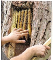
Die geöffnete Kumbibille, Tomasz Dzierzanowski prüft den Wabenbau, die Bienen sind friedlich. ▼