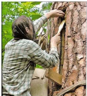
Hongentnahme mit einem Holzspachtel. Die Wabenstücke werden in den höherem Topf, der links am Seil hängt, eingefüllt. Links oben hängt der Smoker am Seil.

Wpisany przez administrator sobota, 31 marca 2012 09:05 -