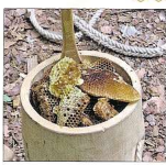
Die geernteten Wabenstücke werden in einem Holzfass gesammelt und mit dem Zeidelmesser fein zerhackt. Größere Wabenstücke sammeln sich an der Oberfläche und können abgeerntet werden, kleinere Wabenstücken bleiben im Honig.

unserer Waldvölker zu verlichten – die Imkerkreise im Umkreis sind uns zu nahe. Jede leer gewordene Beute werden wir immer wieder mit neuen, ausgewählten Bienenvölkchen besetzen müssen“, sagt Tomasz, der frisch gebuckene Zeidler.